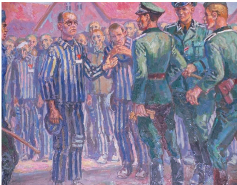
S. Massimiliano Kolbe, martire al campo di concentramento di Auschwitz in Polonia il 14 agosto 1941

L'attuale periodo segna un'ora storica nella quale, specie nei Paesi occidentali, si va in alcuni casi perdendo di vista il valore dell'annuncio evangelico. Della missio . Dell'oblazione totale. I consacrati nella Chiesa non fanno notizia. Neppure un trafiletto di cronaca. Si riesce a trovare qualcosa solo su riviste di congregazioni e su siti ecclesiali. Tale