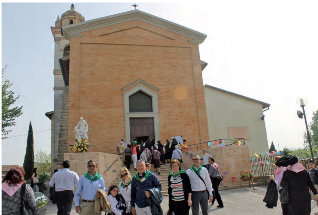
Cannaiola di Trevi: suore e laici insieme

costante che ci rende missionarie e pellegrine, non solo fisicamente, ma anche spiritualmente e interiormente. Vogliamo altresì guardare al nostro caro Padre Fondatore per acquisire una maggiore audacia creativa in questo continuo "uscire" – così come pure papa Francesco invita -, accogliendo le sfide che giungono a noi dall'ascolto dello Spirito e dalla società odierna. In questo tempo di preparazione, infatti, abbiamo già iniziato ad interro-