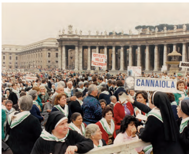
San Pietro, 24 aprile 1988: suore e fedeli alla beatificazione di don Pietro Bonilli