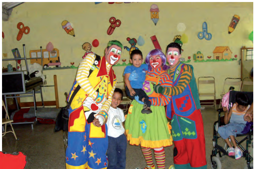
Guarderia Nazaret - Città di Guatemala

Quando sono partite la Chiesa viveva momenti in cui ci si ispirava con entusiasmo all'esperienza fresca e appassionata del dopo Concilio, esperienza che aveva avuto da subito una forte risonanza in tutta