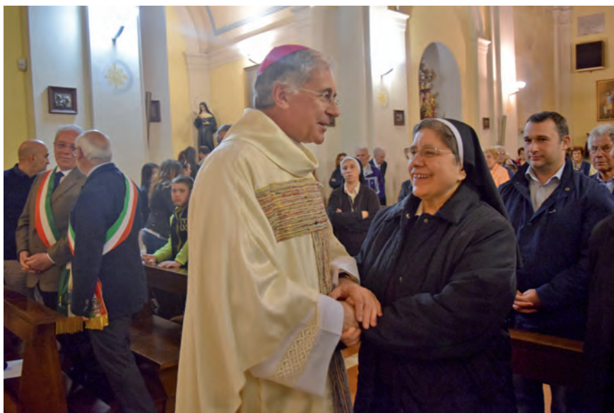
Cannaiola di Trevi: festa del beato Pietro Bonilli 2017

garci: dopo 130 anni di storia, verso quali nuovi orizzonti lo Spirito sospinge le nostre vele? Su quali nuovi sentieri siamo chiamate ad orientare i nostri passi, sebbene siamo un piccolo resto? Come rinnovare i nostri otri per accogliere il vino nuovo?