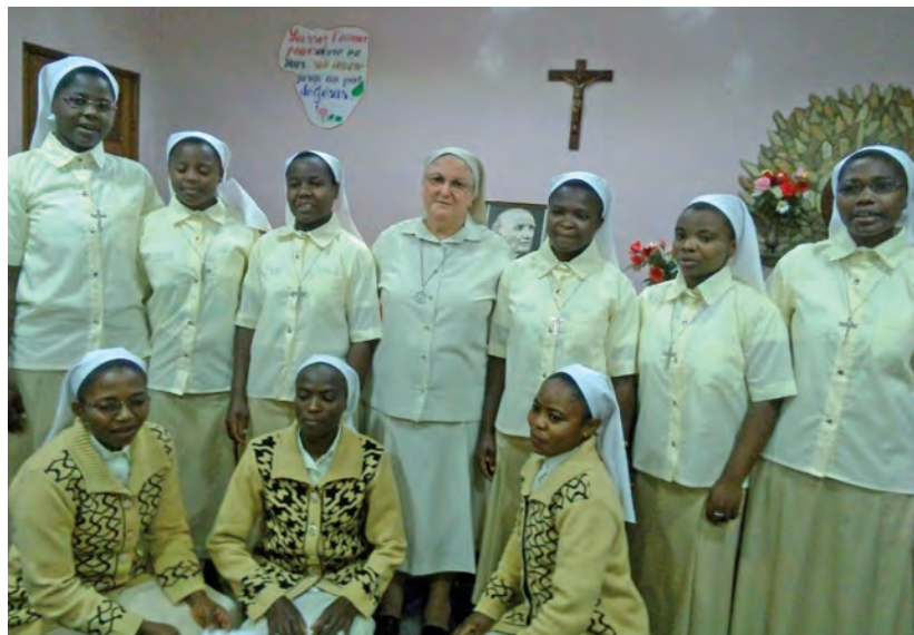
Le sei nuove novizie del Congo

Abbiamo grandi motivi di gioia e di lode al Signore!