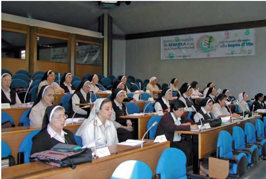
Capitolo del 2006