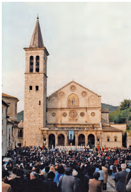
Spoleto: grande festa in Piazza Duomo per la beatificazione del Bonilli

Progettare: il Capitolo generale. Dal 29 giugno al 20 luglio 2018, a Spoleto, le Suore della Sacra Famiglia celebreranno il loro XVII Capitolo generale ordinario dal tema "Da Nazaret per le strade del mondo". Quest'ultimo avvenimento evoca il progettare . Sarà un tempo