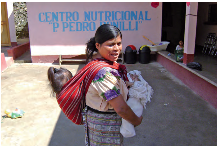
Centro Nutrizionale - S. Juan Cotzal, Quiché

Attualmente si è aperto un Centro Nutrizionale per bambini e per le mamme, un aiuto veramente alla vita, per tanti