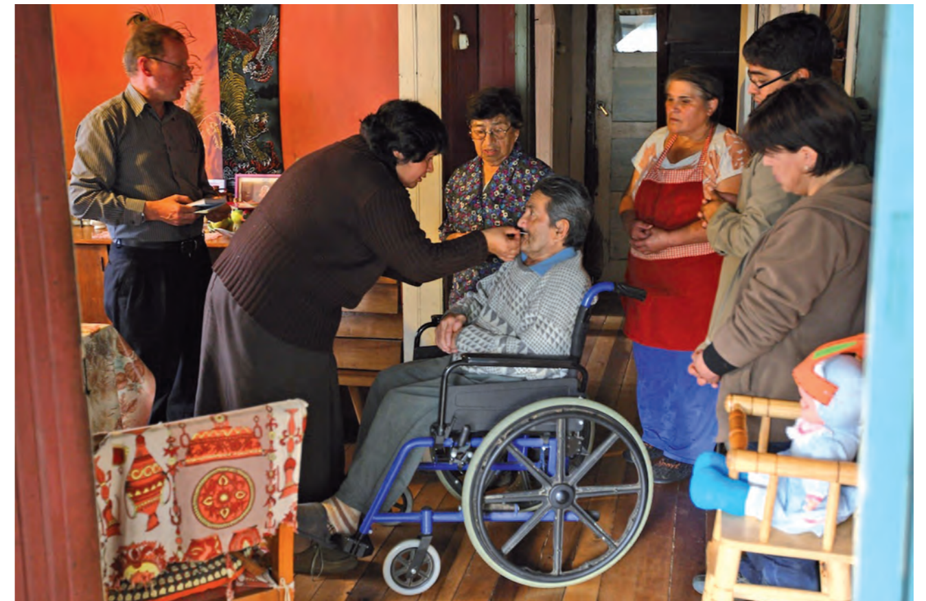
Corral - Valdivia

Iniziano a organizzare la comunità parrocchiale, a formare i laici, a realizzare missioni nei luoghi estremi, facendo conoscere Gesù, secon-