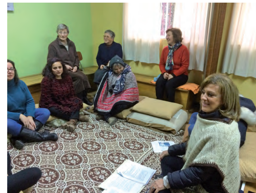
Centro di ascolto Santiago - La Florida

Grazie all'aumento del numero delle Sorelle nella Delegazione e invitate da mons. Gonzalez, Vescovo di Talca e presidente