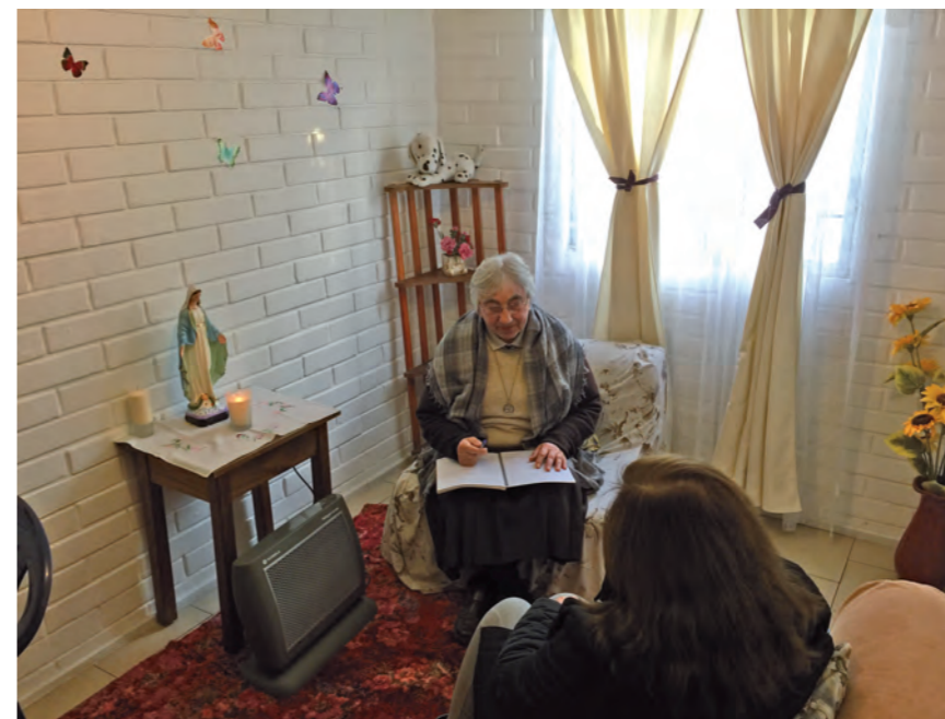
Centro di ascolto Santiago - Puente Alto

"Ritornate quando volete Sorelle...qui troverete la famiglia che voi avete saputo prolungare dalla Sacra Famiglia!". Che il Signore benedica la vostra prossima missione" (dal giornale di Coyaique).