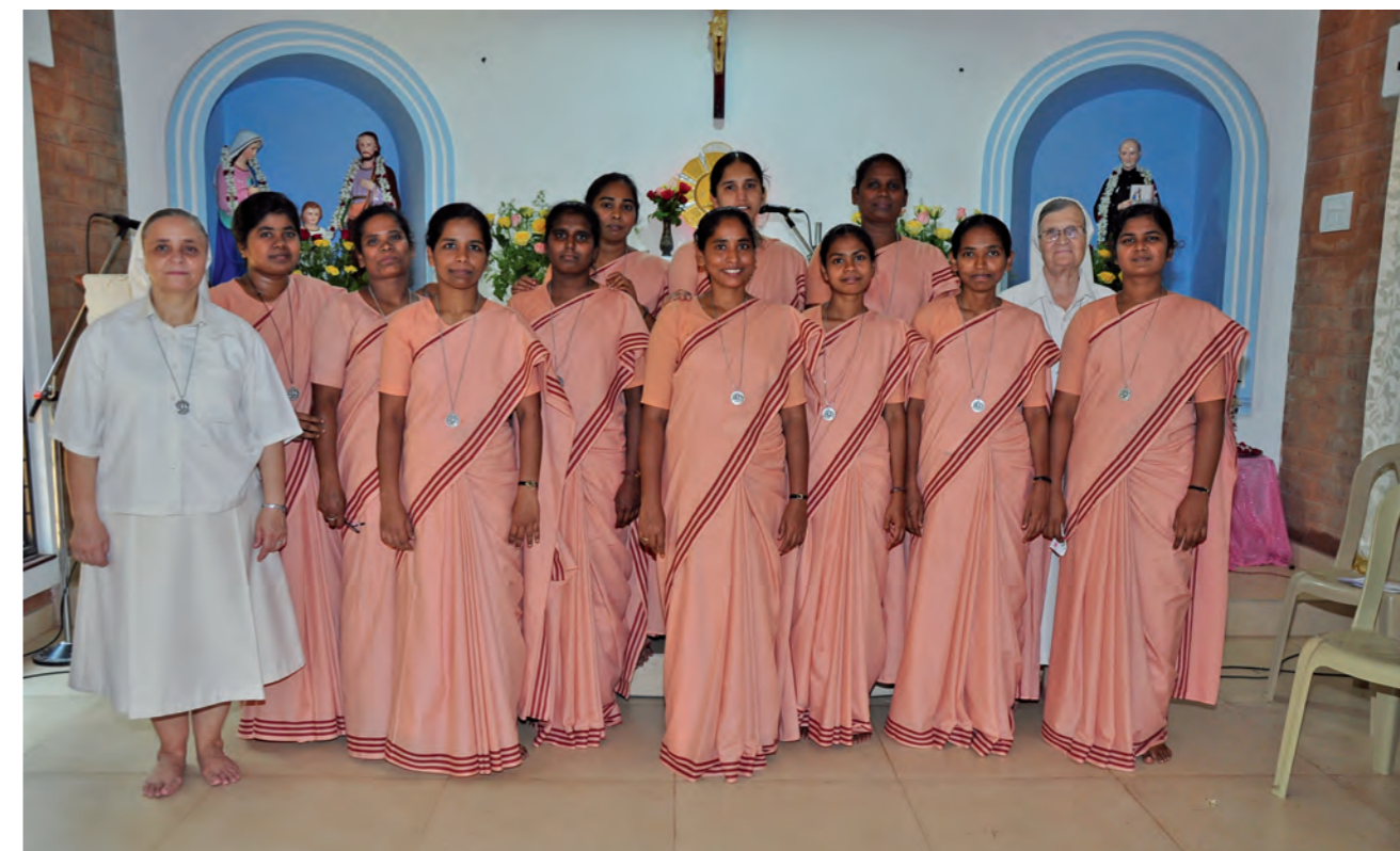
Tutte le Sorelle presenti in India