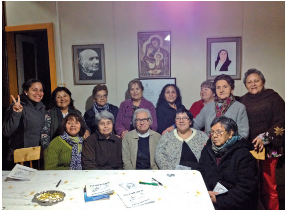
Corral - Valdivia

1994 partono per una nuova missione in Porto Velho, nello Stato di Rondonia, Brasile. (Della Missione del Brasile parleremo nei prossimi numeri).